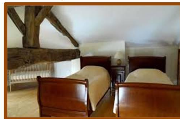
slaapzolder op 2 de etage met drie 1-persoons bedden en speelruimte