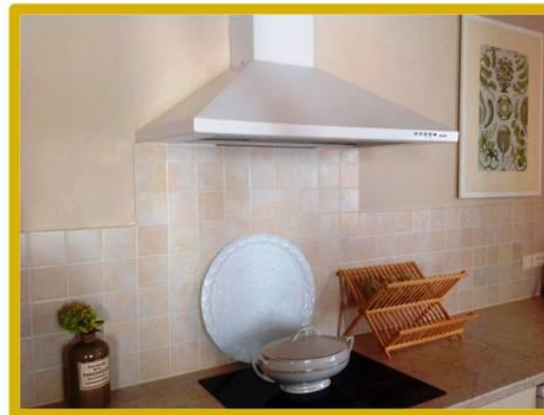
Ruime open keuken met servies, grote koelkast, vriezer, gasfornuis, was- & afwasmachine Ruime eettafel met 7 stoelen

Gîte Magnolia begane grond www.domainecharente.com