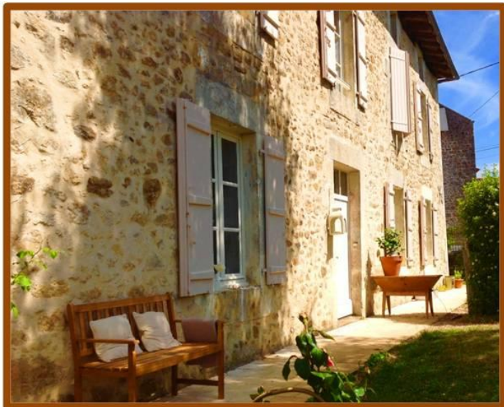
Gîte Magnolia: rechterzijde van hoofdhuis, met eigen tuin en buitentafel + stoelen

Gîte Magnolia begane grond www.domainecharente.com