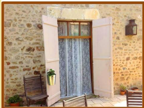
Openslaande deuren naar eigen terras & tuin