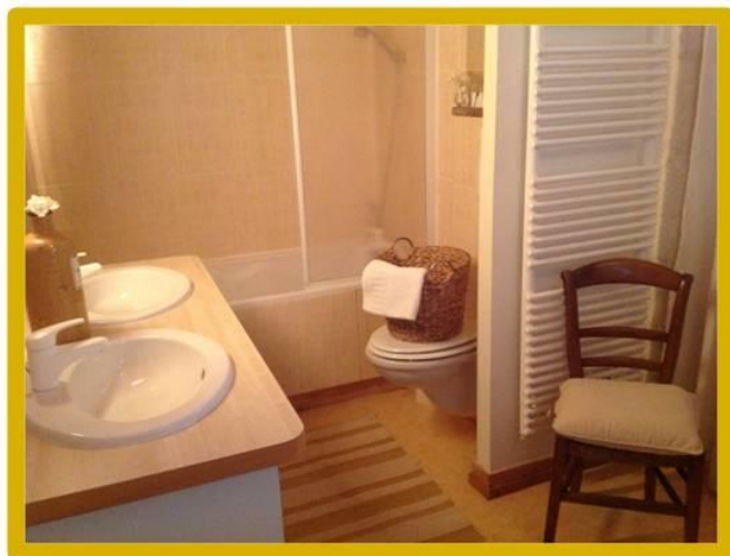
de badkamer op 1 er etage