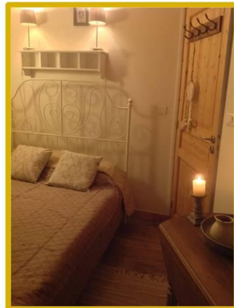
1 kleinere 2-persoons slaapkamer (15m 2 )

Gîte Magnolia 1 er & 2 de etage www.domainecharente.com