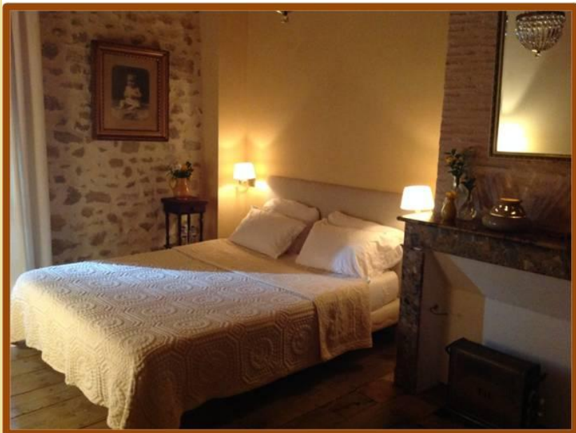
1x ruime 2-persoons slaapkamer (30m 2 )

Gîte Magnolia 1 er & 2 de etage www.domainecharente.com